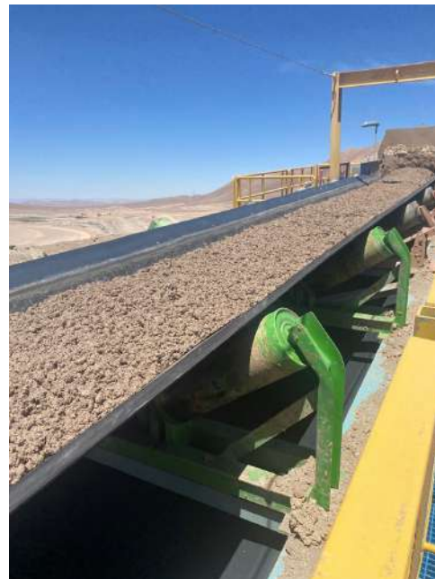
Instalação da correia ABG em uma das maiores mineradoras de cobre no Chile.